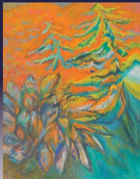
堀由樹子《森の午後》 116.7x91cm 油彩・キャンバス 2016