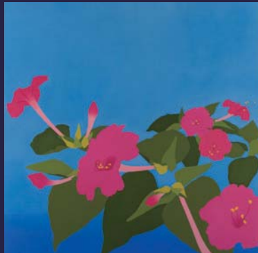
橋本トモコ《明日の幻想-オンロイノバナ》 145.5x145.5cm 油彩・白亜地・綿布・パネル 2016