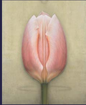
木村佳代子《Birth》 162x130.3cm アクリル・麻紙・パネル 2014