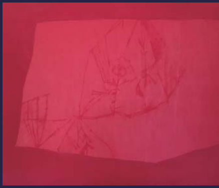
川城夏未《あまつぶもっていつて》 162x194cm 油彩・キャンバス 2014