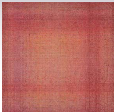
横溝美由紀《Weave Words》 162x162cm 油彩・キャンバス 2012

本展は、「クインテット」(五重奏)と題し、約20年間の継続的な作品発表実績があり、将来有望な5人の作家たちを紹介するシリーズ企画 第3弾で、川城夏未、木村佳代子、橋本トモコ、堀由樹子、横溝美由紀 の近作・新作約 70 点を展示します。