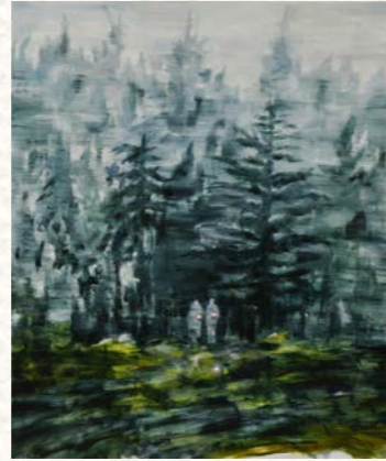
はるき 植田陽貴《whispering》2022年 油彩・キャンバス 194×162cm