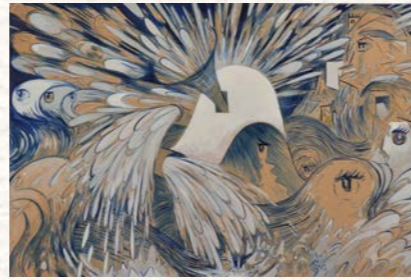
ヨシミヅ コウイチ《顕現(仮)》2022年 アクリル・クラフト紙・パネル 130.3×194cm