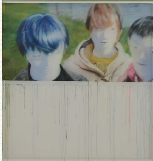
吉田桃子《Still milky_tune #4》2022年 アクリル・ポリエステル布 112×106cm