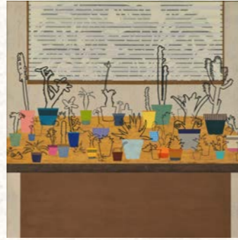
中嶋弘樹《リビングルーム》2022年 岩絵具・アクリル・箔・絹・和紙・ OHPフィルム・キャンバス 162×162cm