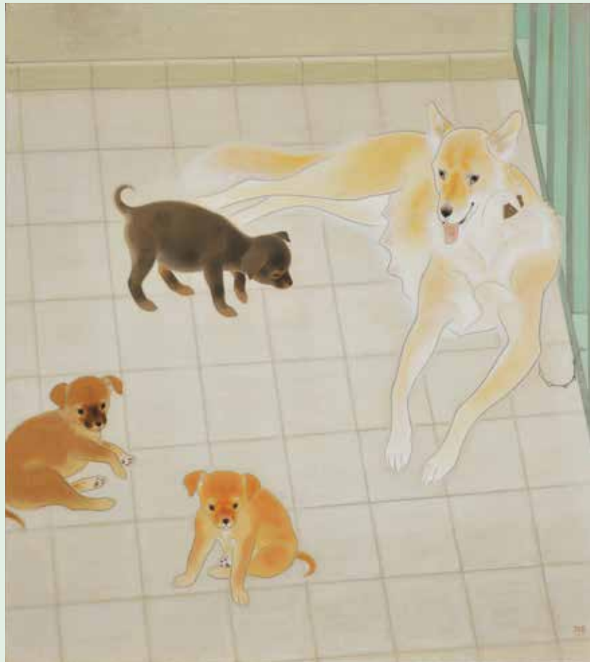
《日向》1949年 紙本彩色 130.0 × 116.5cm 京都国立近代美術館

タイル張りのモダンで明るい空間に、犬が4匹。動物園や公園、山や寺院などに取材することが多かった華楊としては珍しい主題である。迷いのない細い線で平面的に形がとらえられており、写実性よりは、空間における調和に重きが置かれているようだ。犬は親子だろうか。丸みをおびたフォルムとくつろぐ姿が愛らしい。