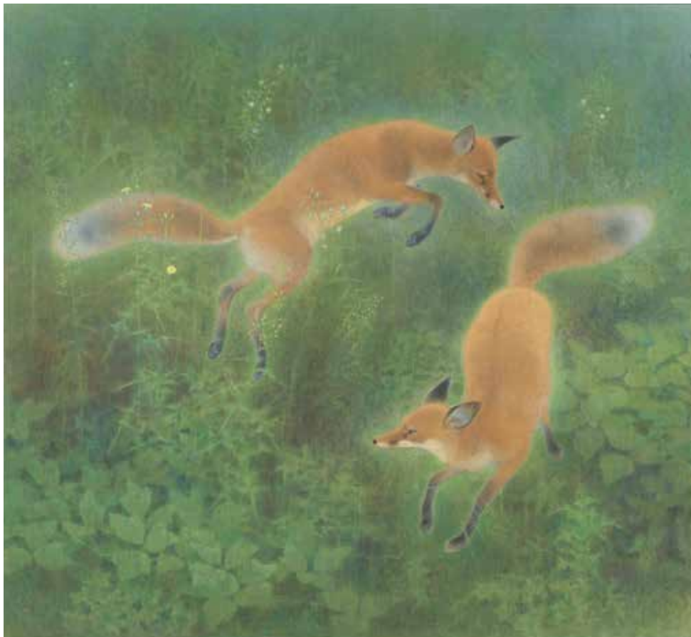
《 げんげ 幻化》 1979年 紙本彩色 155.7×171.1cm SOMPO美術館

華楊は、狐を「人を化かす」ずる賢い動物ではなく、気品ある存在としてとらえているという。晩年には好んで画題とした。幻化とは仏教用語で、「すべてのものに実体はない」という意味。幻の中に遊ぶかのような2匹の狐が織り成す、細やかで奥行き深い空間表現は、写生を常に重んじた画業の集大成といえよう。