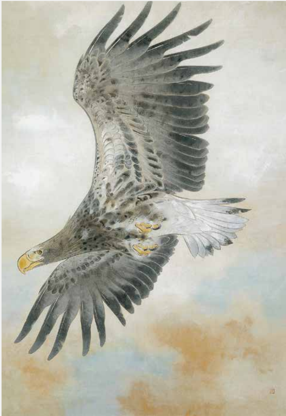
《制空》 1944年 紙本彩色 186.5 × 129.0cm 名都美術館