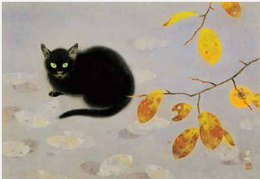
《 しゅうせい 秋晴》 1976年 紙本彩色 50.5 × 73.5cm 北澤美術館