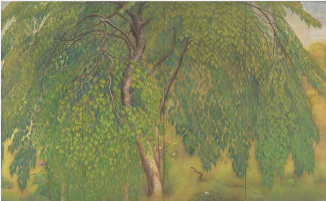
《葉桜》 1921年 絹本彩色 167.4×271.5cm SOMPO美術館

画面全体を覆う青々した葉桜には、生命力がみなぎる。画面下の方には蛇が描き込まれているが、これは知恩院近くで見かけた蛇をもとにしている。その場でつかまえて、自室に持ち帰って写生したと作家本人が回想している。鱗の1枚まで細やかに描かれ、早熟な技量が存分に発揮されている。