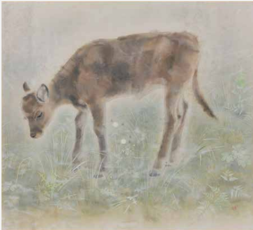
《犢》 こうし 1941年 紙本彩色 143.2 × 157.3cm 京都市立芸術大学芸術資料館

華楊らによって再興された晨鳥社の第1回展に出品した作品。生前の五雲は、絵の題材とするため仔牛を飼っていた。本作は、五雲が没する前年に発表した《麦秋》(1937年)を意識した可能性が指摘されているが、華楊の仔牛は五雲のそれとは対照的に目はうつろで足元がおぼつかなくみえる。背景は抽象的にぼかされ、新たな画風の展開を示す。